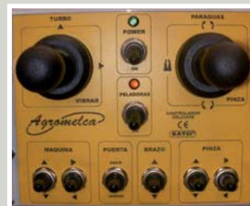
Joystick y selectores