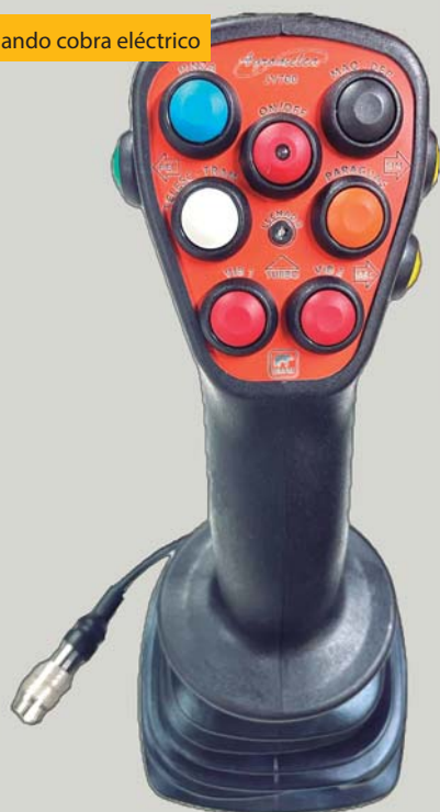
Mando cobra eléctrico