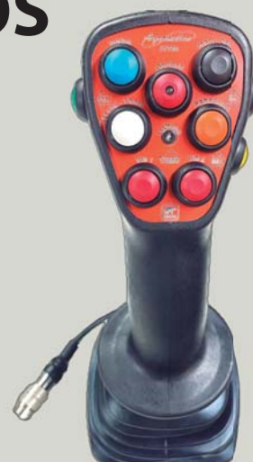
Comando cobra eletrónico