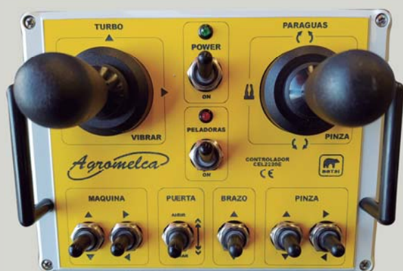
Joystick e selectores