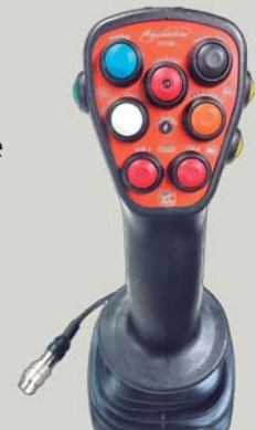
commande cobra électronique